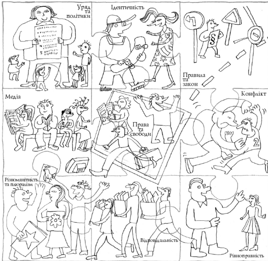
Рис. 2. Пазл-ілюстрація до серії посібників Ради Європи з питань освіти для демократичного громадянства (автор – П. Віксман, 2009 р.) [7, с. 16]

кратичного громадянства та прав людини» [11; 12; 13]. Однак цей напрям не набув досі широкого поширення серед вчителів і загальноосвітніх закладів на відміну від країн Європи, де активно здійснюється така робота в останнє десятиліття.