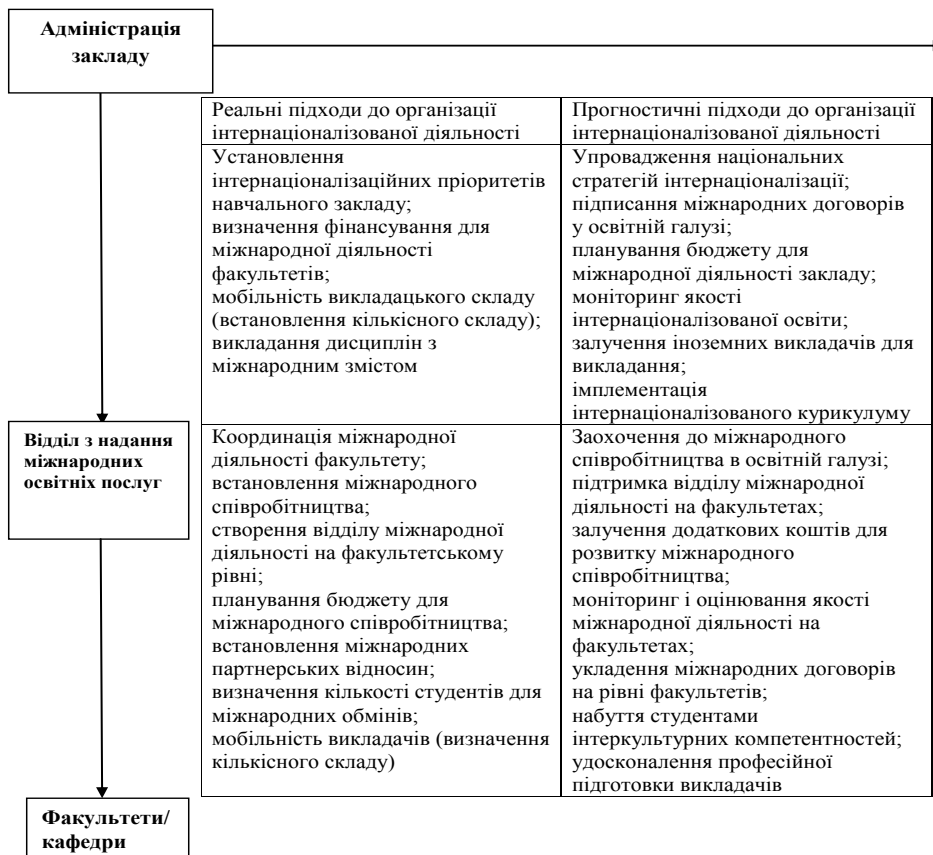
Рис. 4. Адміністративна модель інтернаціоналізації інституційного освітнього простору

Основними суб'єктами організаційної моделі є адміністрація закладу, відділ із надання освітніх послуг, факультети/кафедри, діяльність яких спрямована на впровадження міжнародного виміру у викладання, навчання, освітні послуги та має інтернаціоналізоване забарвлення (рис. 4) [5].