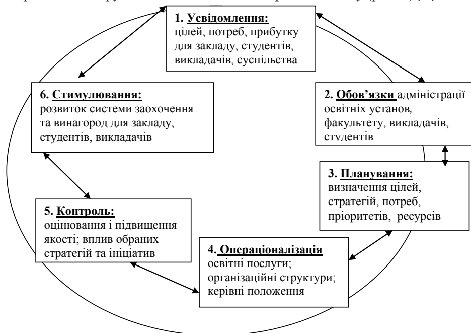
Рис. 3. «Неперервний цикл» інтернаціоналізації інституційного освітнього простору за Дж. Найт

Складові компоненти процесуальної моделі «неперервний цикл», представлені канадською дослідницею Дж. Найт (1993 р.) (усвідомлення, адміністративні обов'язки, планування, операціоналізація, контроль, стимулювання), є взаємопов'язаними, мають двосторонні зв'язки, відображають неперервний цикл впровадження міжнародного виміру в навчально-виховний процес закладу (рис. 3) [3].