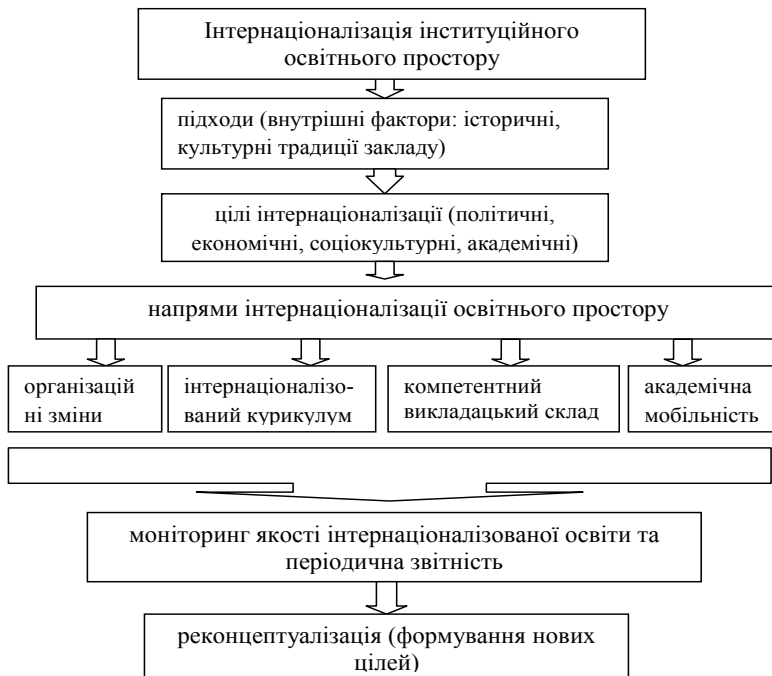
Рис. 5. Структурна модель інтернаціоналізації інституційного освітнього простору

Компонентами оновленої структурної моделі інтернаціоналізації освітнього простору, розкритої в пізніших працях Р. Рудзкі (1998 р.), є підходи, цілі інтернаціоналізації, напрями, моніторинг якості інтернаціоналізованої освіти, реконцептуалізація. В основу моделі покладено комплексний підхід (діяльнісний, прогностичний, компетентнісний, процесуальний) (рис. 5) [7].