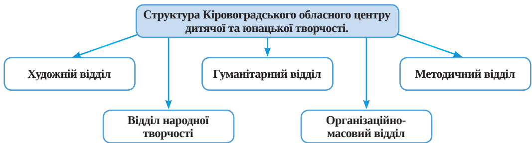
Рис. 2. Структура Кіровоградського обласного центру дитячої та юнацької творчості

Кіровоградський обласний центр дитячої та юнацької творчості (далі КОЦДЮТ) – комунальний, широкодоступний, комплексний, багатопрофільний, деполітизований заклад позашкільної освіти, метою діяльності якого є здійснення єдиної державної і регіональної політики в регіоні, він функціонує як обласний позашкільний методичний та навчально-виховний центр. На сьогодні заклад вважається потужним науково-дослідним центром апробації нового змісту навчання, у ньому розробляються сучасні педагогічні технології та новітні методики навчання і виховання, створюються умови для повного розкриття особистості.