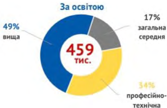
Рис. 1. Характеристика зареєстрованих безробітних осіб за освітою. Данні від 1 січня 2021 р. надані Державною службою зайнятості.

Як доказ необхідності реформування чинної системи професійного орієнтування можна привести статистику, яку надала Державна служба зайнятості 1 січня 2021 року.