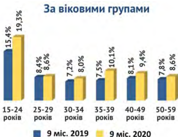
Рис. 2. Рівень безробіття населення за віковими групами. Інформація надано Державною службою України від 1 січня 2021 року.

За даними Державної служби зайнятості, найбільший рівень безробіття спостерігається серед молоді віком 15–24 роки (Ситуація на ринку праці та діяльність державної служби зайнятості, 2020).