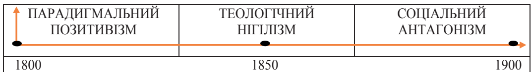
Рис. 4.3. Соціокультурна трансформація вітчизняної світоглядної парадигмальності в умовах прямого впливу полікультурності (XIX ст.) [6; 7; 11].

Таким чином, інтелектуалізм, ментальність, полікультурність сплїтали своєрідну невидиму павутину невидимого соціокультурного зв'язку інтелігентної педагогічної спільноти українства із освіченою Європою. Показник національної окремішності у цьому випадку послугував основоположним базисом для реалізації прогресивних національно-державницьких проектів на поч. ХХ ст.