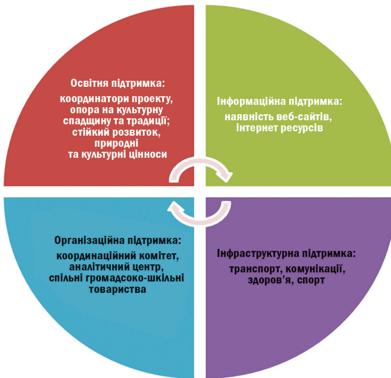
Рис. 1. Модель впровадження педагогіки партнерства в умовах Карпатського освітнього простору

Дослідження формувало основи педагогіки партнерства, надаючи інформацію та пропозиції щодо можливих змін для підтримки впровадження системи ключових компетенцій у майбутньому. На основі проведеної роботи нами розроблена Модель реалізації педагогіки партнерства в умовах Карпатського освітнього простору (рис. 1).