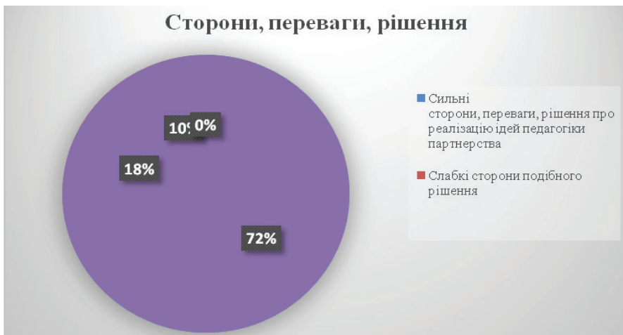
Рис.2. Результати SWAT-аналізу

Результати проведеного SWAT-аналізу показали, що у контексті реформування шкільної освіти в Україні проблема функціонування шкіл Карпатського освітнього простору є доволі значною. Результати SWAT-аналізу подано на рис. 2, рис.3.