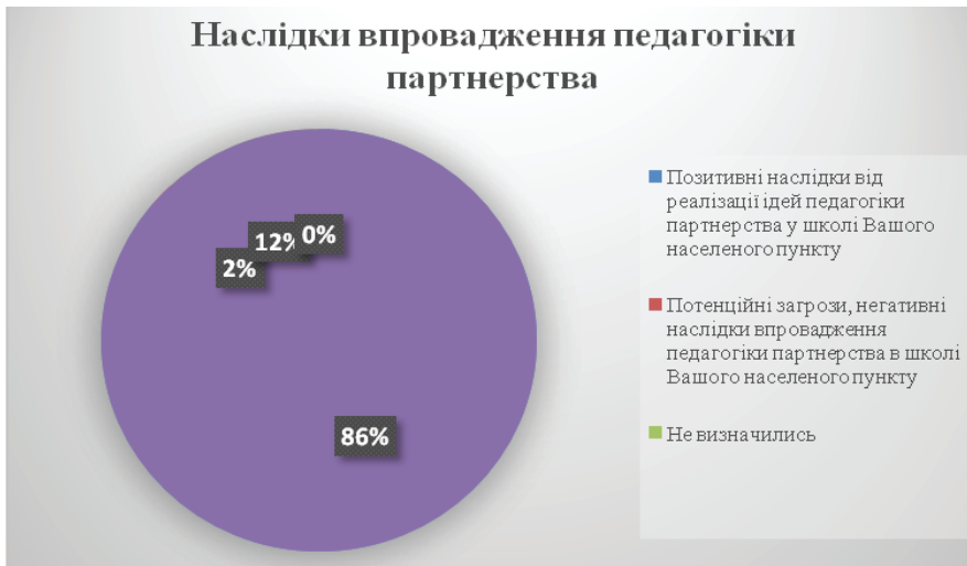
Рис. 3. Результати SWAT- аналізу

Як видно з діаграм, сильні сторони у впровадженні педагогіки партнерства вбачають 72% респондентів і лише 18% - слабкі сторони цього процесу. Щодо наслідків реалізації ідей педагогіки партнерства, то у своїй більшості (86%) переважають позитивні зміни у впровадженні педагогіки партнерства.