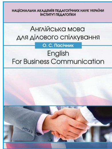
Пасічник О.С. «Англійська мова для ділового спілкування».

Упровадження зазначених елективних курсів у практику старшої школи урізноманітнює, розширює та поглиблює зміст шкільної іншомовної освіти новими засобами й технологіями їх використання, сприяє її адаптації до європейських стандартів.