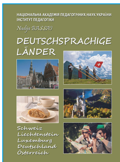
Басай Н.П. «Німецькомовні країни».