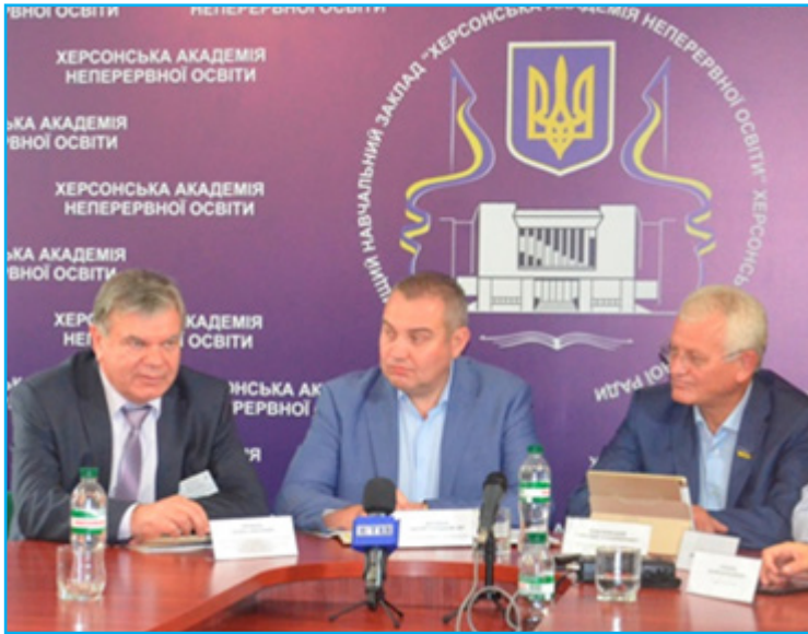
Апробація проекту Закону України «Про освіту» за участю президента НАПН України В.Г. Кременя та першого заступника голови Комітету Верховної Ради України з питань науки і освіти О.В. Співаковського в Херсонській академії неперервної освіти