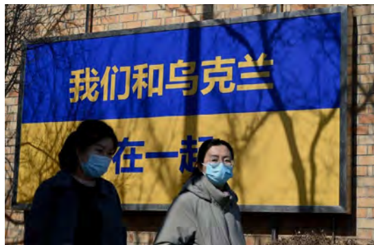
На плакаті написано: Ми разом з Україною

Отже, засудження російської агресії проти України, порушення міжнародних договорів, підтримка України та українських науковців, припинення співпраці з російськими університетами є ключовими складниками заяв представників наукової спільноти світу. Важливо також наголосити, що навіть представники країн, що не висловлюють такої підтримки, демонструють солідарність з Україною. Прикладом є відкритий лист, підписаний понад 200 випускниками Університету Цінхуа, із закликом до університету позбавити Путіна звання почесного доктора, присудженого в 2019 р. «Путін – розпалювач війни, який вів війни проти Чечні, Криму, Грузії, а останнім часом нахабно розв'язав загарбницьку війну, якій протистоїть і засуджує переважна більшість країн у всьому світі. Наше звернення відбиває волю значної частини випускників Цінхуа. Ми не очікуємо, що звернення матиме суттєві результати, але ми сподіваємося, що більше людей дізнається, що є багато китайців, які на боці людства, рішуче засуджують Путіна та російську армію за вторгнення, і ми твердо підтримуємо український народ у своїй боротьбі проти агресора» (South China Morning Post, 2022).