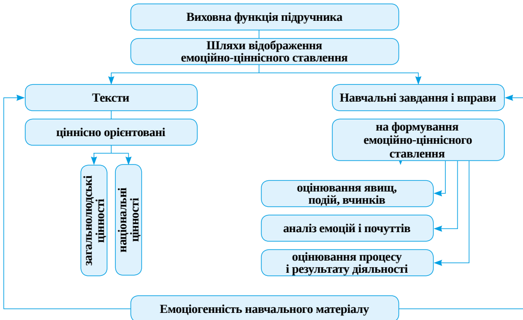
Рис. 2. Виховна функція підручника для початкової школи

Процесуальний компонент дидактичної підготовки студентів націлює на формування в них дидактичних умінь і навичок (у тому числі й рефлексивних), суб'єктивного досвіду особистості. Відомо, що вміння і навички виробляються у процесі діяльності, тобто шляхом виконання відповідних завдань і вправ. З цієї метою радимо урізноманітнювати способи проведення лекцій