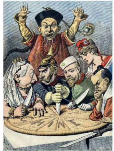
Розділ Китаю європейськими державами й Японією. Карикатура 1890-х років

Стереотипні образи ворогів і союзників часто пропагувалися за допомогою сатиричних карт. Працюючи з сатиричними картами різних воюючих країн, доцільно застосувати порівняльний підхід. Зокрема, під час вивчення причин та передумов Першої світової війни учням можна запропонувати практичну роботу з аналізу сатиричних карт такого змісту: