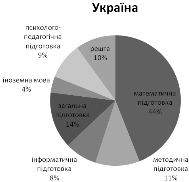
Рис. 3. Розподіл предметів у навчальному плані підготовки вчителя математики у Національному педагогічному університеті імені М. П. Драгоманова