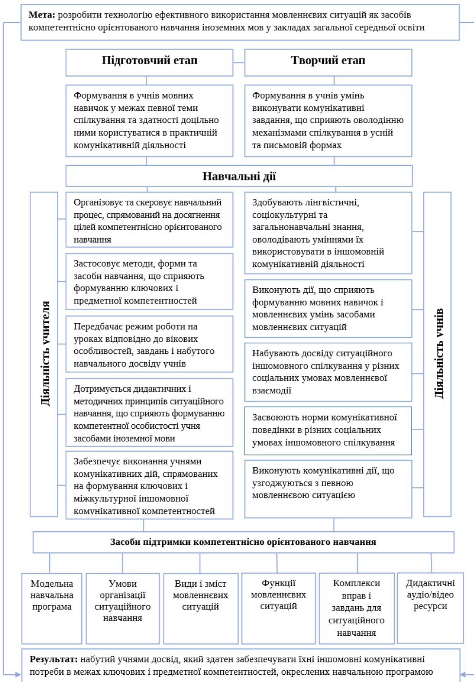
Рис. Модель ситуаційного компетентнісно орієнтованого навчання іншомовного спілкування в закладах загальної середньої освіти