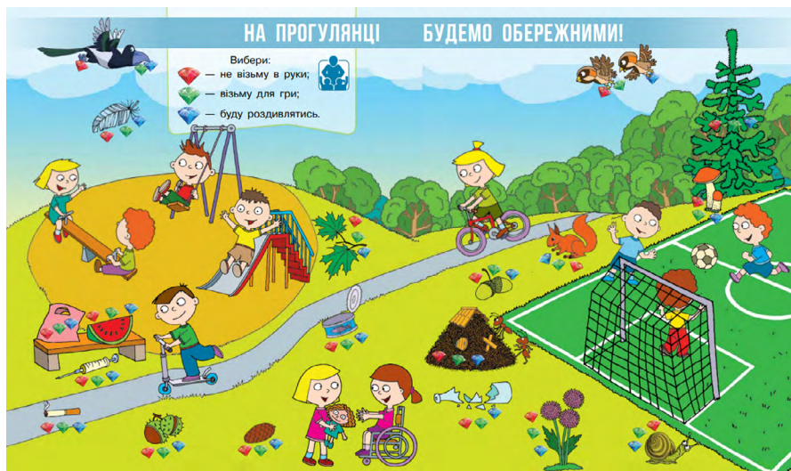
(Бібік, 2018, с. 16–17).

Знайди на малюнках першу букву свого імені; цифру — скільки тобі років.