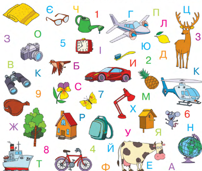
(Бібік, 2019, с. 7).

По черзі скажіть, що із зображеного не належить до природи. Що можна назвати словом транспорт ? З перших букв назв яких предметів можна скласти слово школа ?