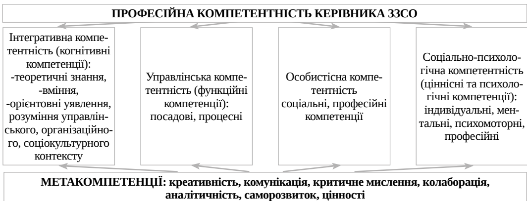
Рис. 2. Модель професійної компетентності креативного керівника в умовах державно-громадського управління на засадах партнерської взаємодії (Авторська розробка)

Принциповим є те, що реалізація цієї гіпотези та побудова моделі професійної компетентності креативного керівника в умовах державно-громадського управління на засадах партнерської взаємодії (Рис.2) надає «керівникові певні діяльнісні орієнтири відносно змісту і характеру здійснюваних функцій, у тому числі й стосовно вироблення та реалізації раціональних управлінських рішень у так званих проблемних чи нестандартних ситуаціях, особливо в умовах інформаційної невизначеності та ризику» (Кремень, 2008).