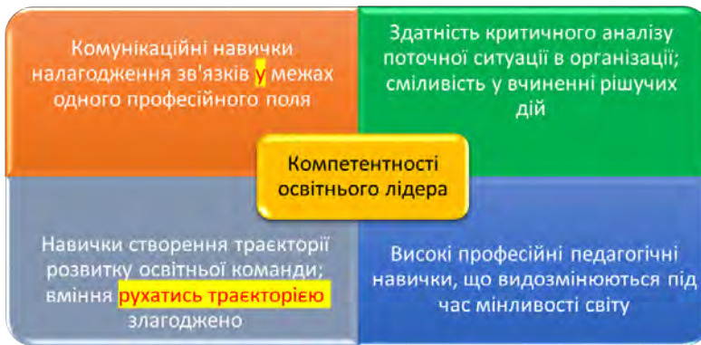
Рис. 2. Узагальнений профіль компетентностей магістра освітнього лідерства (MEL) Університету прикладних наук Стендена (Нідерланди)

У площині лідерства, студент розвиває персональні особистісні компетентності, професійні навички і професійну ідентичність. Студенти-магістри мають визначитись із індивідуальним планом в межах стандартної програми разом зі своїм освітнім консультантом. Індивідуальний навчальний план напряму залежить від попередніх знань студентів, його навчальних потреб, а також подальших кар'єрних перспектив. Однак перед цим майбутні здобувачі проходять процедуру вступу. Допускним рівнем до відповідної магістерської програми є здобутий раніше ступінь бакалавра. Крім того, абітурієнтів очікує вступна співбесіда, яка має на меті скласти уявлення про потенційного студента як про особистість і професіонала, про його мотивацію та компетентності, необхідні для успішного завершення програми, особисті цілі та взаємні очікування. Під час вступу студентам також пропонується виконати завдання на тему лідерства в організації, що є частиною процедури вступу.