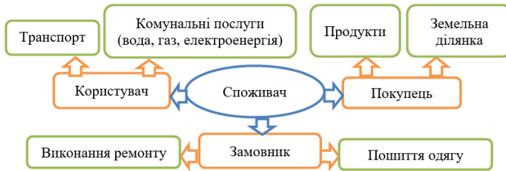
Рис.1. Кластер до поняття «споживач»

З опорою на життєвий досвід та за допомогою методу «кластер» учні можуть із ключовим поняттям створити видові зв'язки (рис.1).