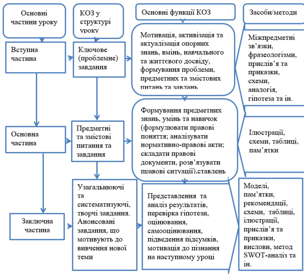
Рис. 7. Модель КОЗ у структурі уроку

Запропонована модель КОЗ може використовуватися як під час формування та застосування знань, умінь, навичок, комбінованого уроку, так і під час практичного заняття.