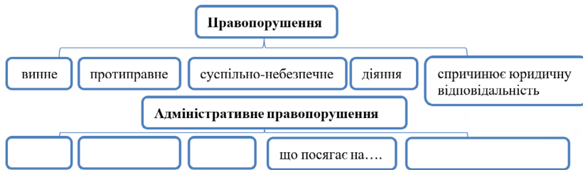
Рис.5. Формулювання поняття «адміністративне правопорушення»

Правові ситуації є важливими джерелами, в яких реалізується комплекс КОЗ з основ правознавства (робота з поняттями, нормативно-правовими актами, правовими документами та ін.). Прикладом КОЗ є пам'ятка розв'язання правової ситуації: