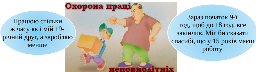
Рис. 4. Праця неповнолітніх

2. Проаналізуйте ситуацію, що на ілюстрації (рис. 4). Обґрунтуйте правомірність/протиправність дій учасників.