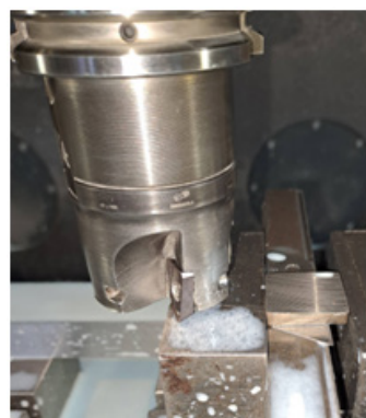
Рис. 3. Обробка поверхні зразків на ЧПУ DMG MORI-1100

На наступному етапі поверхня зразків шліфувалася на плоскошліфувальному верстаті 3Д722 і доводилася ручним шліфуванням на шліфувальному наждачному папері із зернистістю 1000, 1500 та 2000, періодично змінюючи напрям шліфування. На завершальному етапі здійснювалося полірування зразків на полірувальному крузі з натуральної повсті з додаванням автомобільної полірувальної пасти K2, яка надає ефект хіміко-механічного полірування, та промивання технічним спиртом і дистильованою водою. На рис. 4 представлено загальний вигляд одержаних зразків.