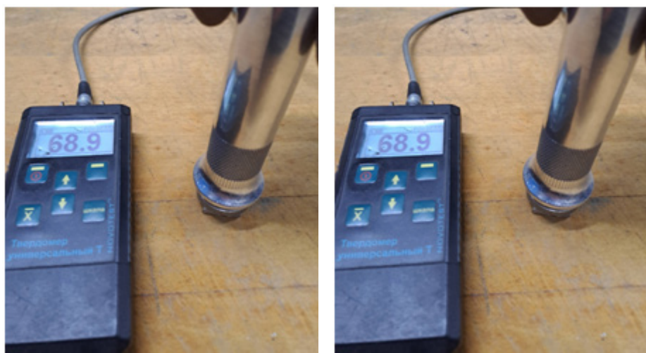
Рис. 5. Вимірювання твердості на ультразвуковому твердомірі NOVOTEST T

На рис. 6 наведено графік залежності твердості за Віккерсом від ступеня деформації (числа циклів) досліджуваних зразків. Як бачимо, із зростанням числа циклів деформації до чотирьох твердість різко зростає, а далі зменшується.