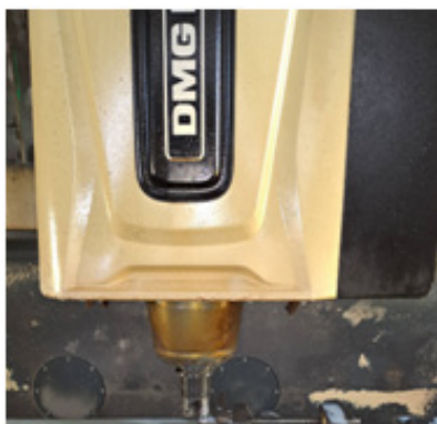
Рис. 2. Вирізаний зразок

Описаним методом було підготовлено заготовки з різною кількістю циклів пресування: 2, 4, 6, 8 та 12. Далі з них вирізалися зразки завтовшки 4-5 мм (рис. 2) та проводилися попередня обробка поверхні на фрезерувальному верстаті 6P13 і чистова обробка на верстаті з числовим програмованим управлінням (ЧПУ) DMG MORI-1100 (рис. 3).