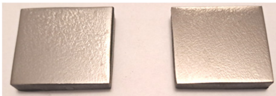
Рис. 4. Вигляд поверхні зразків після фінального полірування

На наступному етапі поверхня зразків шліфувалася на плоскошліфувальному верстаті 3Д722 і доводилася ручним шліфуванням на шліфувальному наждачному папері із зернистістю 1000, 1500 та 2000, періодично змінюючи напрям шліфування. На завершальному етапі здійснювалося полірування зразків на полірувальному крузі з натуральної повсті з додаванням автомобільної полірувальної пасти K2, яка надає ефект хіміко-механічного полірування, та промивання технічним спиртом і дистильованою водою. На рис. 4 представлено загальний вигляд одержаних зразків.